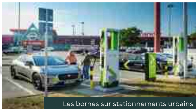
Les bornes sur stationnements urbains

Afin de couvrir un large éventail de zones équipées en stations de recharge de véhicules électriques, SCA VALMA a défini quatre secteurs privilégiés à hauts potentiels de développements et d'expansions économiques qui seront accessibles aux épargnants: