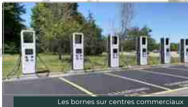
Les bornes sur centres commerciaux