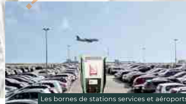
Les bornes de stations services et aéroports

Dans le cadre de ce placement de bornes électriques accessibles à tous, il sera proposé aux épargnants, dans un premier temps, la « récupération » d'une seule borne, choisie selon les critères de choix du client, pour un capital indiqué sur le tableau en fonction du stationnement sélectionné.