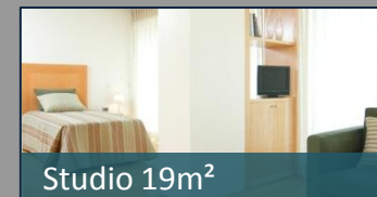
Studio 19m 2