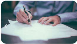
Capital et rendements garantis

Face au rendement des supports bancaires, l'inflation, et de la situation économique en France, l'investissement dans le secteur des énergies renouvelables est devenu une alternative de placement qui attire toutes les catégories d'investisseur, à la recherche d'un rendement attractif et garanti.