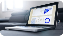
Secteur en pleine croissance