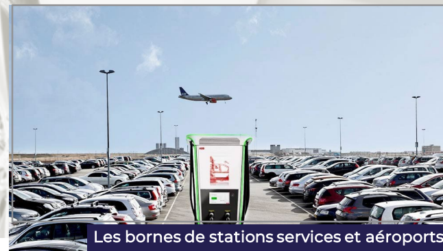
Les bornes de stations services et aéroports

Dans le cadre de ce placement de bornes électriques accessibles à tous, il sera proposé aux épargnants, dans un premier temps, la « récupération » d'une seule borne, choisie selon les critères de choix du client, pour un capital indiqué sur le tableau en fonction du stationnement sélectionné.