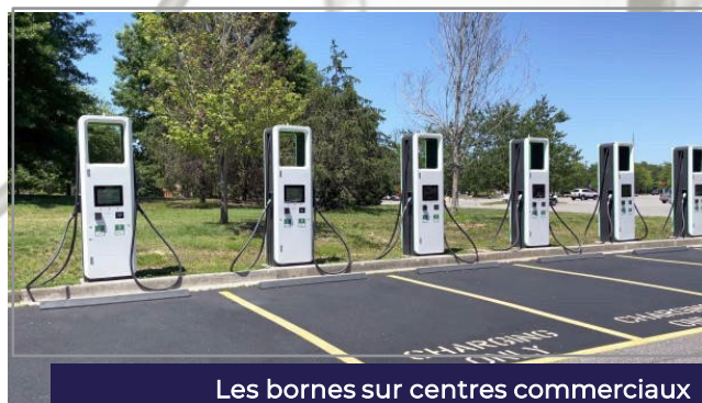
Les bornes sur centres commerciaux