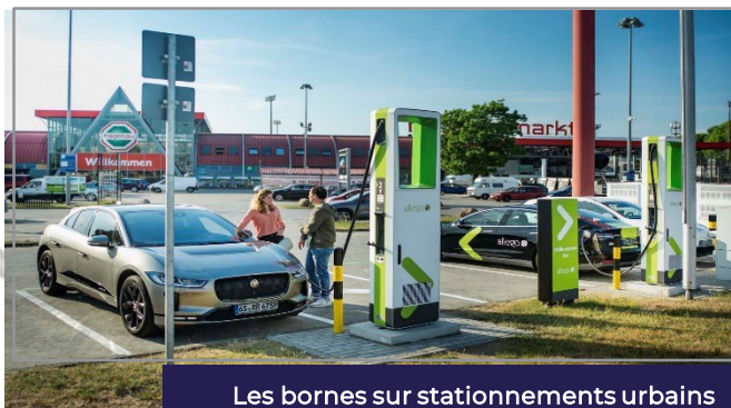
Les bornes sur stationnements urbains

Afin de couvrir un large éventail de zones équipées en stations de recharge de véhicules électriques, LYS VENDOME a défini quatre secteurs privilégiés à hauts potentiels de développements et d'expansions économiques qui seront accessibles aux épargnants: