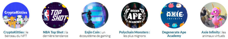
CryptoKitties : le berceau du NFT NBA Top Shot : la dernière tendance Enjin Coin : un écosystème de gaming Polychain Monsters : les plus mignons Degenerate Ape Academy Axie Infinity : les animaux virtuels

D'autres NFTs peu connues disponibles et très prometteurs! Nous ne manquerons pas de vous renseigner des nouvelles opportunités de NFT, contactez nos experts !