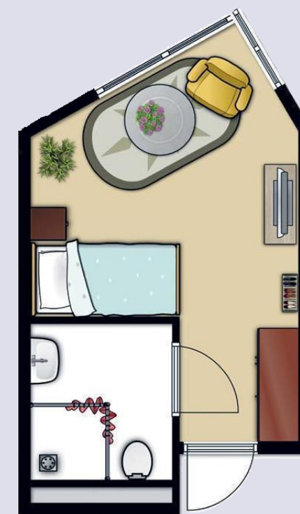
Chambre simple: espace de vie 20,47 m 2

Toute la maison et le jardin sont accessibles en fauteuil roulant. Profitez de la journée dans la cafétéria ensoleillée.