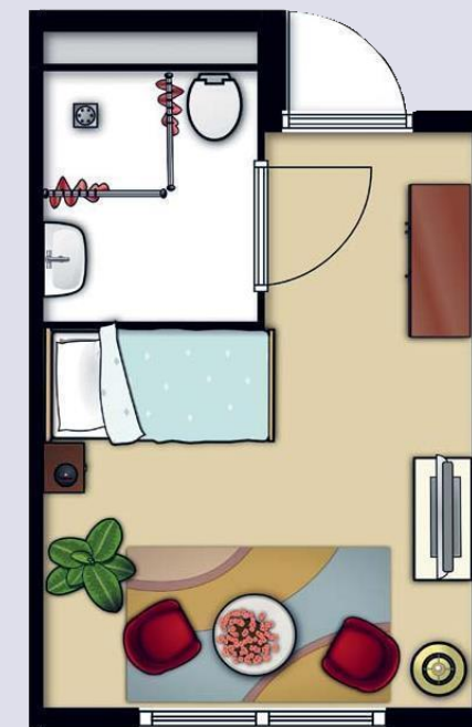
Suite: espace de vie 25,62 m 2