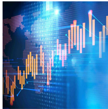
Manipulation du marché

Des promesses de « bénéfices garantis » d'une offre initiale de pièces (ICO), d'une opération de minage dans le cloud ou d'un investissement dans des jetons cryptographiques ? Les promoteurs des stratagèmes de Ponzi sollicitent les investisseurs avec de grandes discussions sur l'innovation du marché et les informations d'initiés, mais au lieu de placer les fonds des clients dans un investissement légitime, ils détournent l'argent pour se remplir les poches.