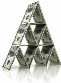
Schémas de Ponzi

La crypto-monnaie, les blockchains et la finance décentralisée sont de véritables innovations avec un potentiel d'impact positif sur les systèmes financiers. Mais ce sont aussi des mots à la mode qui ont été maltraités et exploités pour promouvoir des stratagèmes frauduleux, notamment la fraude aux investissements et la manipulation illégale du marché. Les vols de crypto-monnaie, le blanchiment d'argent, les ransomwares et le financement du terrorisme menacent davantage l'intégrité de ces nouvelles technologies. Le marché des crypto-monnaies est en première ligne dans la lutte contre la criminalité financière.