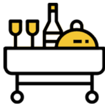
Service en chambre