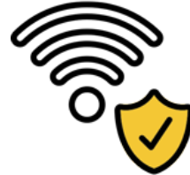
Wi-Fi haut débit