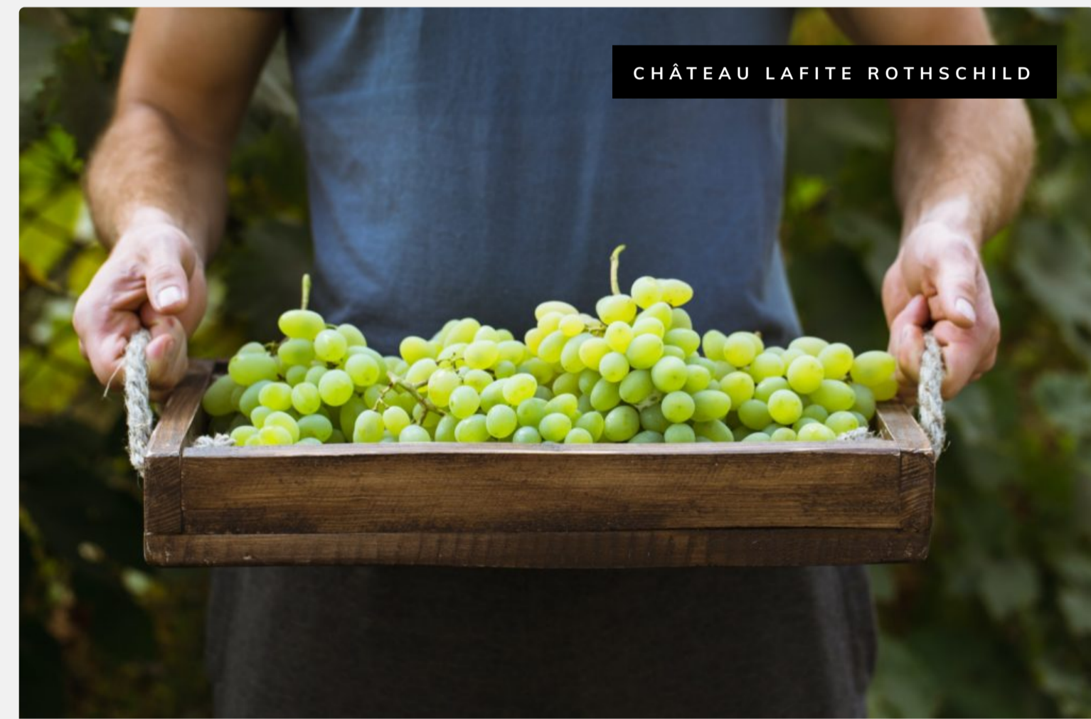
CHÂTEAU LAFITE ROTHSCHILD

Le château Haut-Brion est le domaine viticole le plus réputé du vignoble des Graves. Il est situé dans l'aire d'appellation du pessac-léognan.