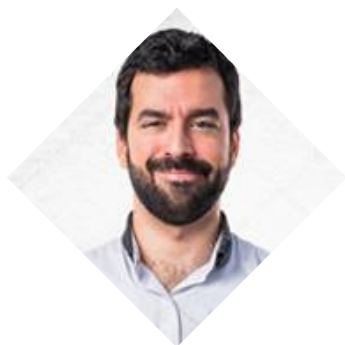
Bobby T. Honolulu Hawaï Bénéfice: 10737,62 €

«Je négocie des paires forex et crypto depuis sept ans, mais mes gains avec le code Bitcoin en seulement quatre semaines sont les meilleurs résultats de ma carrière de commerçant. Le fait que je n'aie pas à faire grand-chose pour atteindre des résultats aussi étonnants, le rend plus pratique et rentable pour moi. Un grand bravo à l'équipe du code Bitcoin. Vous êtes top les gars!»