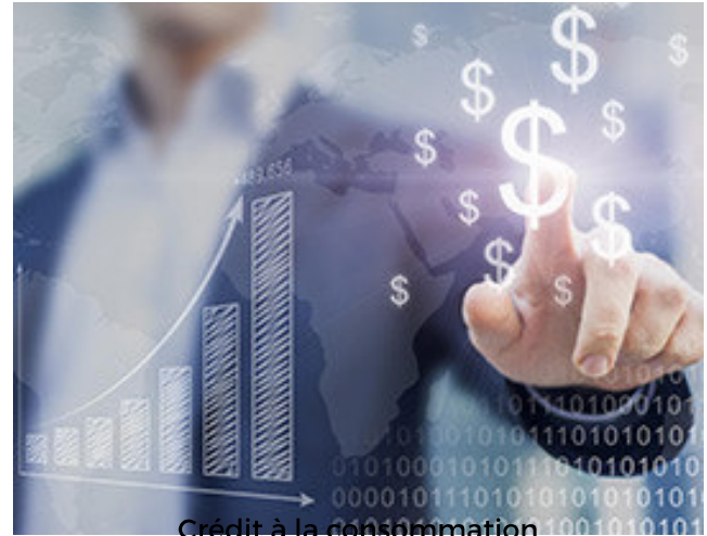
Crédit à la consommation