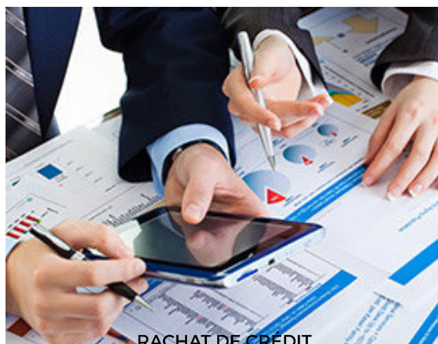
RACHAT DE CRÉDIT

Un prêt pour couvrir vos besoin: vacances en famille,